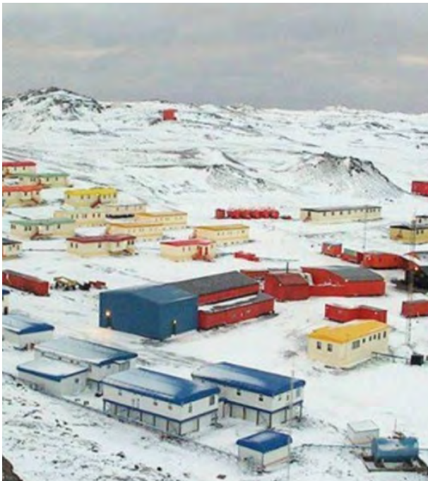
Parte del complejo Frei, en bahía Fildes, isla Rey Jorge.

La base Escudero está inserta en el complejo de la base Frei y la Capitanía de Puerto, entonces se dieron instancias de comunicación y relación con distintas personas; pasamos navidad, año nuevo, en un ambiente distinto, donde no está la familia y era necesario crear ese ambiente para que la gente se sintiera integrada.