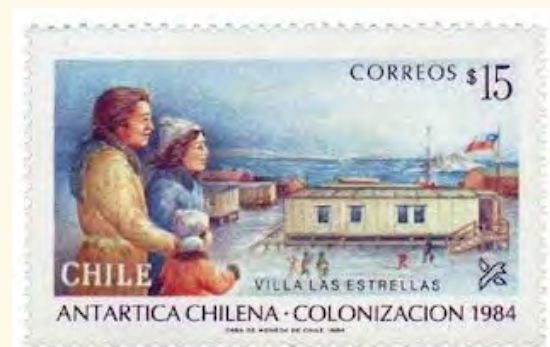
Estampilla conmemorativa de Correos de Chile.