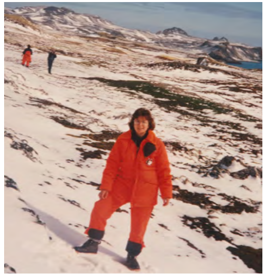
En Bahía Fildes, temporada 1993.