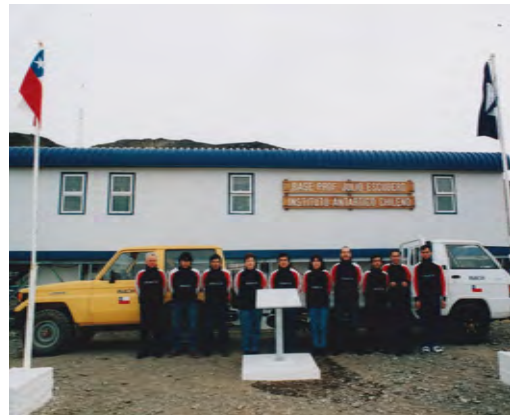
Equipo de la Base Profesor Julio, temporada 1998/1999.