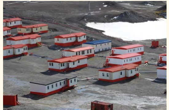
Villa Las Estrellas en pleno verano antártico.

El futuro de Magallanes, debe construirse hoy. De lo contrario, la Historia señalará responsabilidades cuando otras naciones desarrollen sus zonas más extremas, mientras los chilenos nos quedamos a la vera del camino, haciendo proyectos para un futuro que nunca llega.