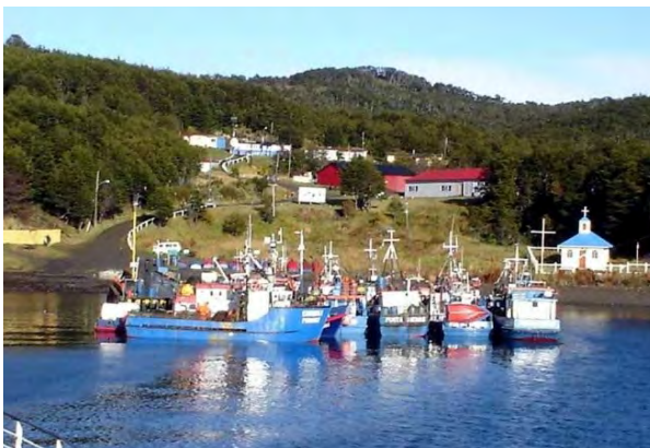
Arriba: Puerto Toro, el poblado más austral del mundo. Derecha: la prensa de Punta Arenas informó sobre las actividades realizadas:

https://elpinguino.com/digital/edicion/01-02-2023-18.html