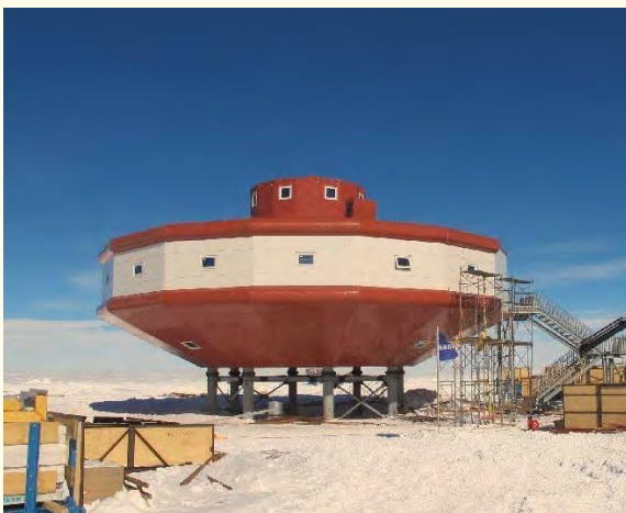
Base Taishan, de la República Popular China.