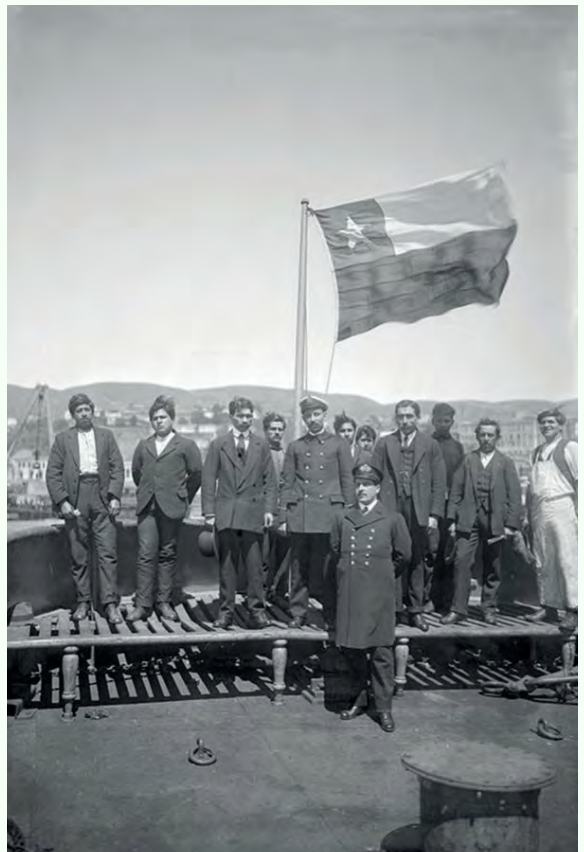
Luis Pardo Villalón a bordo de la Yelcho junto a parte de su valerosa tripulación.

Luis Pardo Villalón fue ascendido al grado de Piloto 1° el 7 de septiembre de ese año; se anotó su proeza como nota de mérito especial en su hoja de vida. Se ha publicado que, con cortesía pero con firmeza, rechazó un obsequio de veinticinco mil libras esterlinas ofrecido por el gobierno británico al estimar que no era acreedor a ese premio porque, como marino de Chile, había cumplido una misión que le había sido encomendada. El Piloto 1° don Luis A. Pardo Villalón falleció en Santiago el 21 de febrero de 1935, a los 54 años de edad.