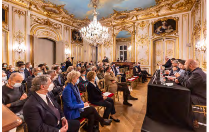
Esta actividad fue organizada por el Instituto France Amérique, fundado en 1909.

La institución organizadora del evento se creó en 1909 bajo el nombre Comité France-Amérique (CFA) y se constituye en el punto de encuentro privilegiado de las élites franco-americanas en el mundo de la diplomacia, los negocios, las finanzas, la investigación, la defensa y la cultura.