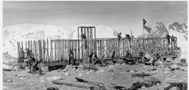
Faenas de construcción de la base original